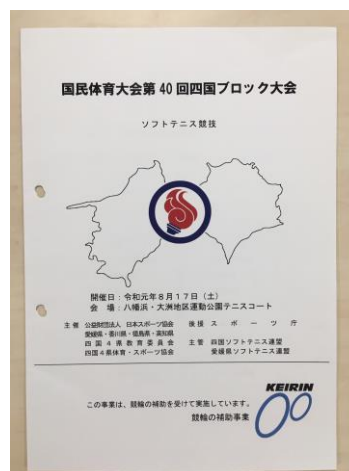
令和元年度国民体育大会第40回四国ブロック大会 ソフトテニス競技プログラム

※ 上記の他、各ブロックにおいて大会プログラム、実施要項、大会報告書等を適宜作成した。