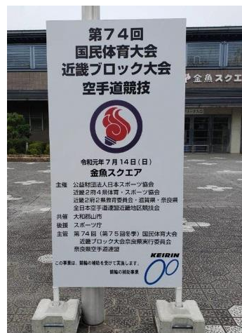
国民体育大会近畿ブロック大会 空手道競技会場の表示