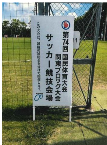
国民体育大会関東ブロック大会 サッカー競技会場の表示

全国9ブロックで実施した国民体育大会ブロック大会に対し、開催費の一部を助成した（参加者42,707名）。