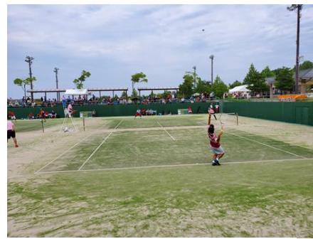
国民体育大会中国ブロック大会 ソフトテニス競技会の模様