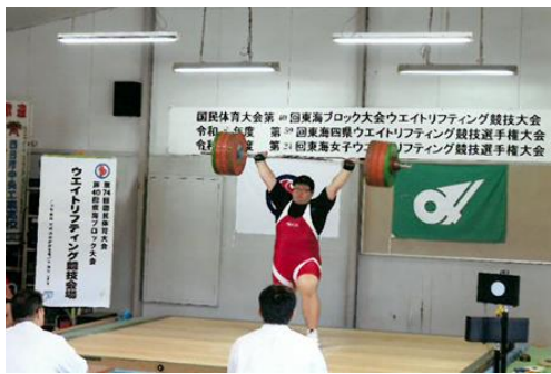
国民体育大会東海ブロック大会 ウエイトリフティング競技会の模様