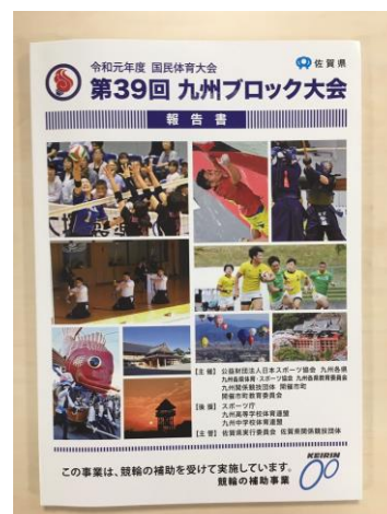
令和元年度国民体育大会第39回九州ブロック大会報告書